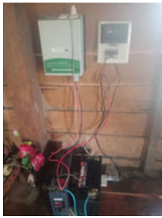
រូបភាព៣៖ ការប្រើកុងត្រូល័រនិងអាំងវែទ័រ

គ) កង្វះការយល់ដឹងការប្រើប្រាស់អាគុយនិងកុងត្រូល័រក៏ធ្វើឱ្យអាគុយឆាប់ខូចនិងប្រើបាន រយៈពេលខ្លី ដោយសារការប្រើថាមពលអាគុយហួសកំណត់ ដូចជាសម្រាប់បូមទឹក ឬឧបករណ៍ផ្ទាំងភ្លើងដែលស៊ីភ្លើងច្រើន។