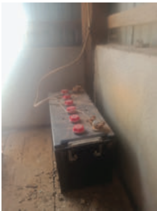
រូបភាព២៖ ការសាកអាគុយដោយផ្ទាល់

ខ) ដោយសារតម្លៃតភ្ជាប់និងតម្លៃបណ្តាញផ្គត់ផ្គង់អគ្គិសនីរបស់រដ្ឋមានតម្លៃថោកនិងងាយស្រួលប្រើបច្ចុប្បន្នតម្លៃអគ្គិសនីនៅជនបទប្រហែល៦០០រៀលក្នុងមួយគីឡូវ៉ាត់ម៉ោង ដែលធៀបនឹងតម្លៃប្រហែល ២៥០០រៀលនៅ៧-១០ឆ្នាំមុន ធ្វើឱ្យគ្រួសារមួយចំនួនធំបានបោះបង់ការប្រើប្រាស់បន្ទះសូឡា ឬប្រើគ្រាន់តែដើម្បីសាកអាគុយមួយសម្រាប់បំភ្លឺអំពូលសូឡាពេលយប់តែប៉ុណ្ណោះ (រូបភាព២)។