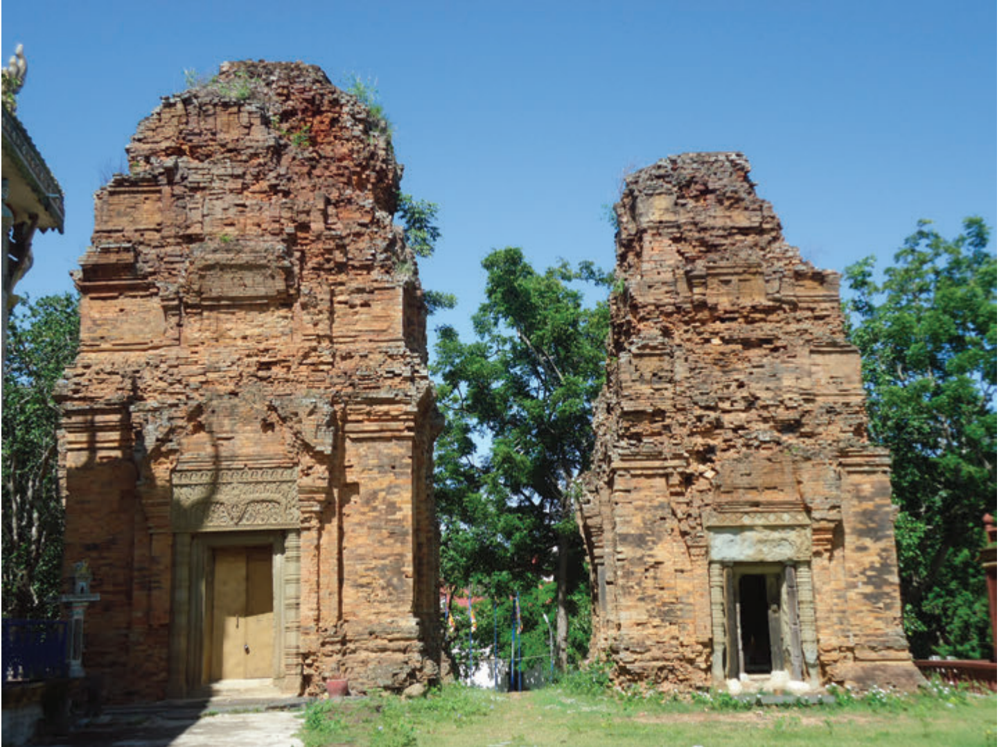
ប្រាសាទភ្នំជីស្ទរ