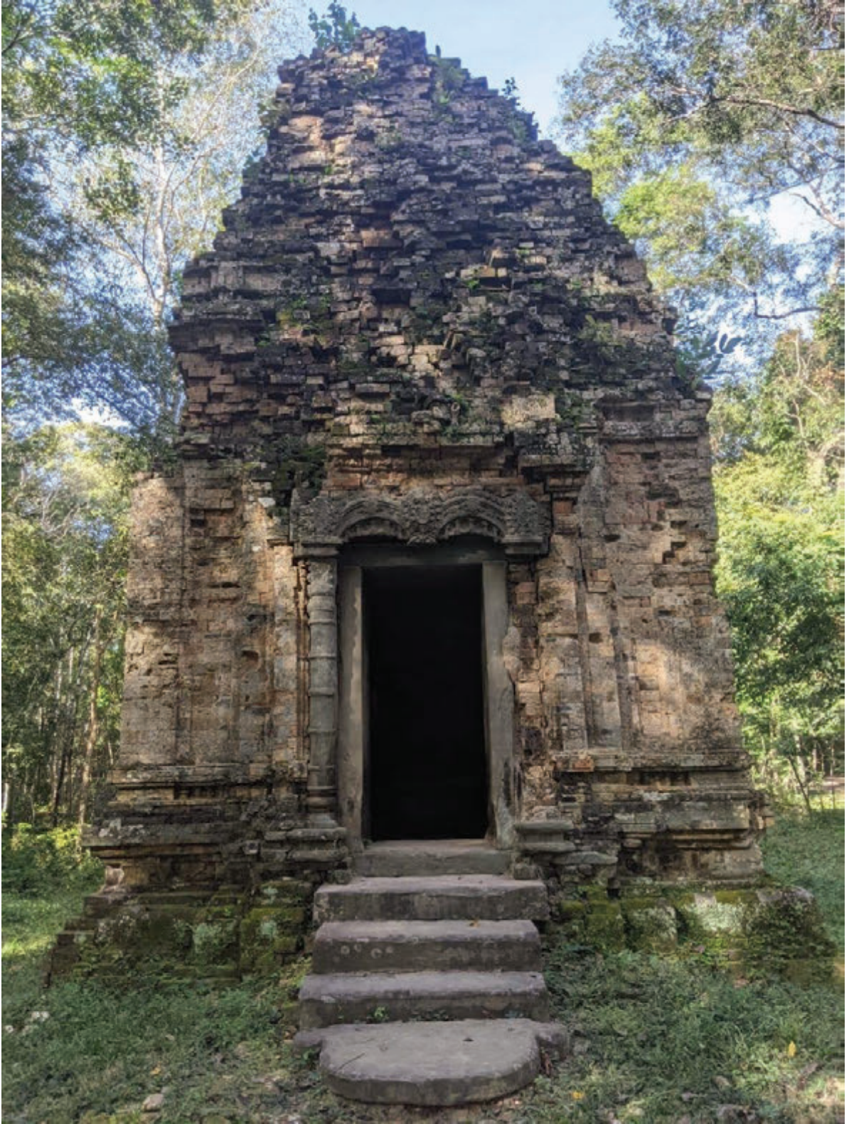
ប្រាសាទស្រីជ័យ