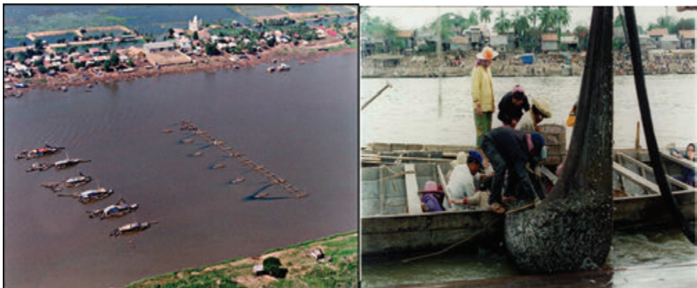
រូបទី២១. ដោយត្រីជួរទី៩ តាមដងទន្លេសាប រូបទី២២. ដោយនេសាទត្រីល្អិតនៅខែមករា

នៅអំឡុងពេល៥០មក៤០ឆ្នាំចុងក្រោយនេះការប្រើប្រាស់ចង់ធ្លាក់ស្លឹកសម្រាប់ការវេចខ្ចប់នានាត្រូវបាន គេអនុវត្តនៅគ្រប់ទីកន្លែងក្នុងប្រទេសដែលរួមទាំងនៅក្នុងប្រព័ន្ធលំនៅដ្ឋានលើទឹក និងនៅជិត ជាប់ស្ទឹង ព្រែក