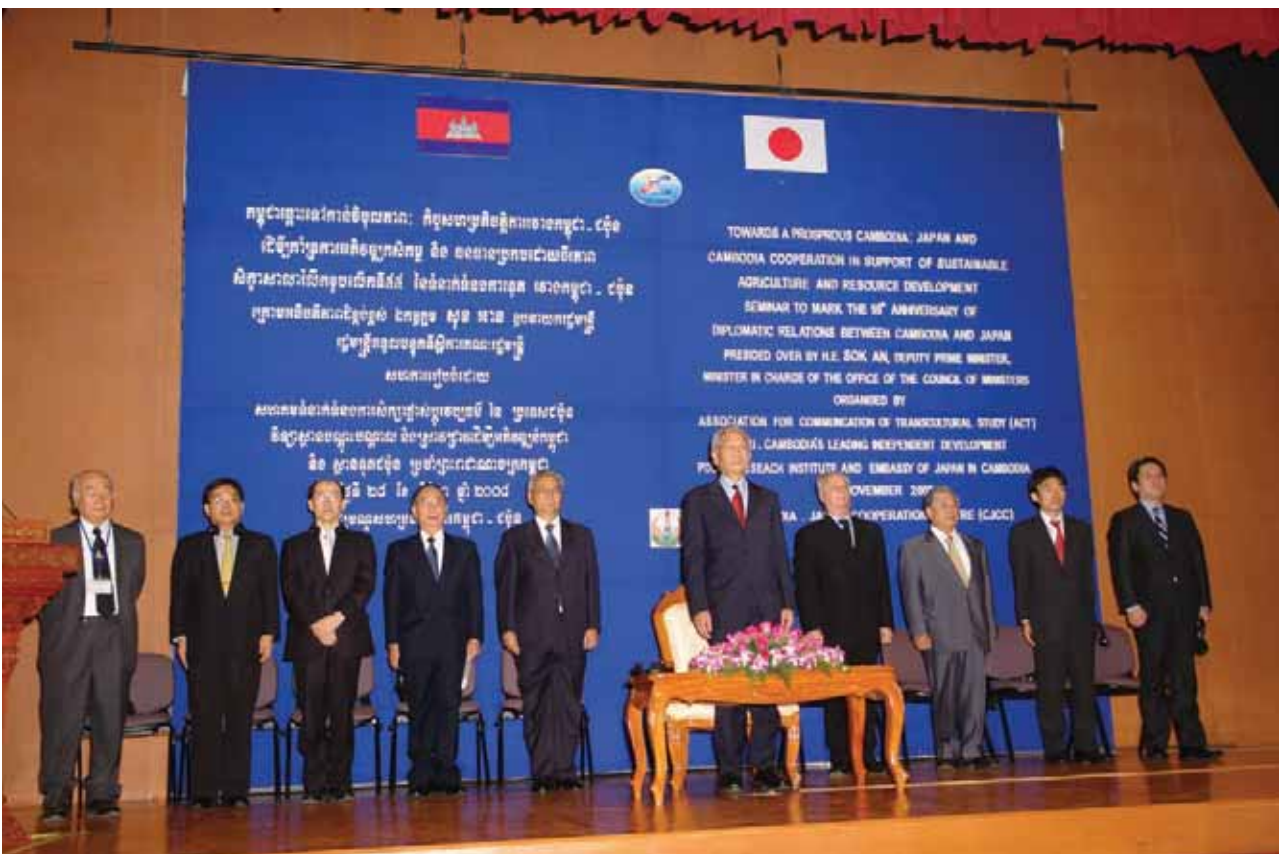
វិទ្យាស្ថានភាសាបរទេស នៃសាកលវិទ្យាល័យភូមិន្ទភ្នំពេញ ថ្ងៃទី ២៨ ខែ វិច្ឆិកា ឆ្នាំ ២០០៨