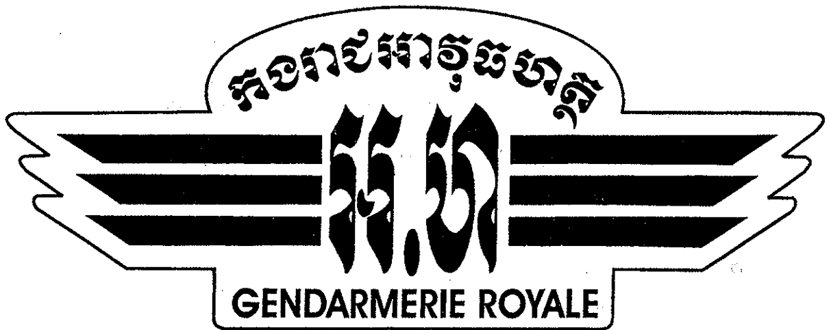
សំរាប់បិតផ្ទះសំរាំង