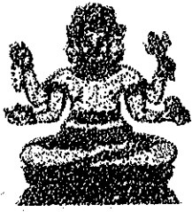
ក្រុមប្រឹក្សាធម្មនុញ្ញ