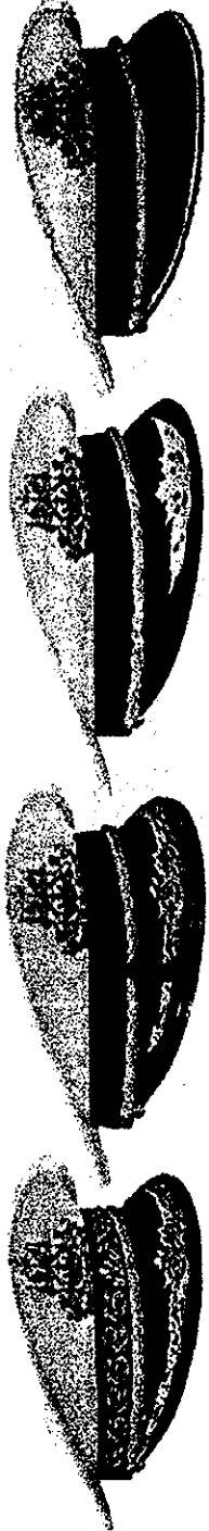
មួកការស្តុក

ឧបសម្ព័ន្ធគ្រប់គ្រងប្រកាសលេខ ..... ចុះថ្ងៃទី ..... ខែ ..... ឆ្នាំ ២០០០